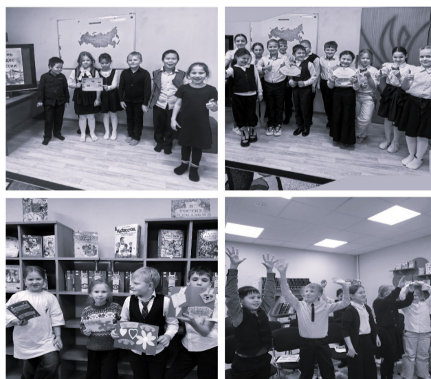
Литературная квиз-игра «Знатоки сказок»

В завершение экскурсии ребята стали участниками викторины «Вся Россия», которая позволила им проверить свои знания о нашей стране.