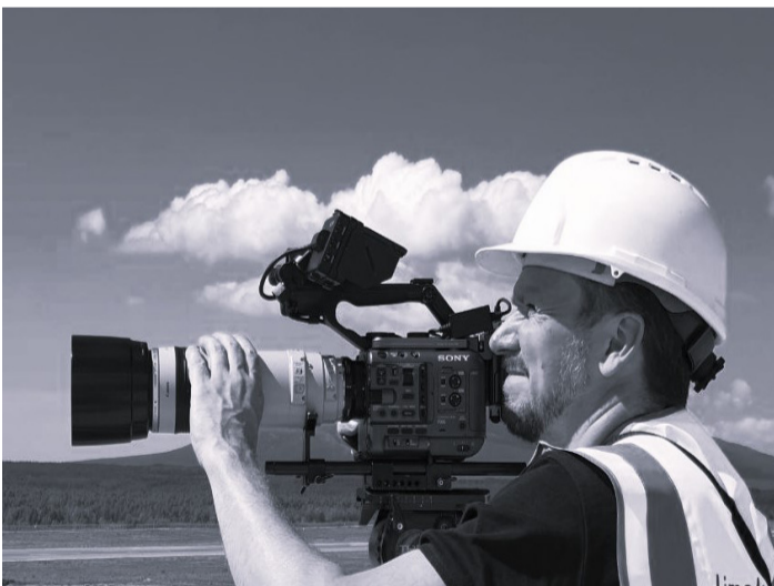
Фильм о жизни в Магаданской области.

Фильм снимает телевизионная группа «Россия-24». На счету команды, которую возглавляет специальный корреспондент телеканала Алексей Михалёв – это уже четвертый